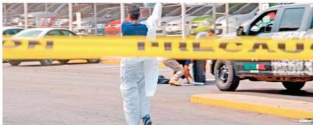
En la Avenida Universidad, junto a un lote de autos, quedó el cuerpo de una persona que fue ejecutada a balazos a plena luz del día.