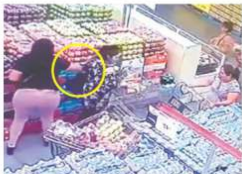
Un video que circula en redes muestra cómo a la víctima le cierran el paso con carros, mientras una mujer le saca la cartera del bolso.