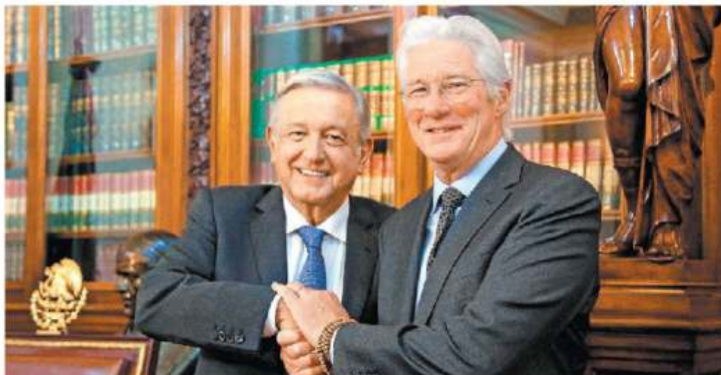
El Presidente recibió en Palacio al actor estadounidense Richard Gere en su actual papel de defensor de derechos humanos. ESPECIAL