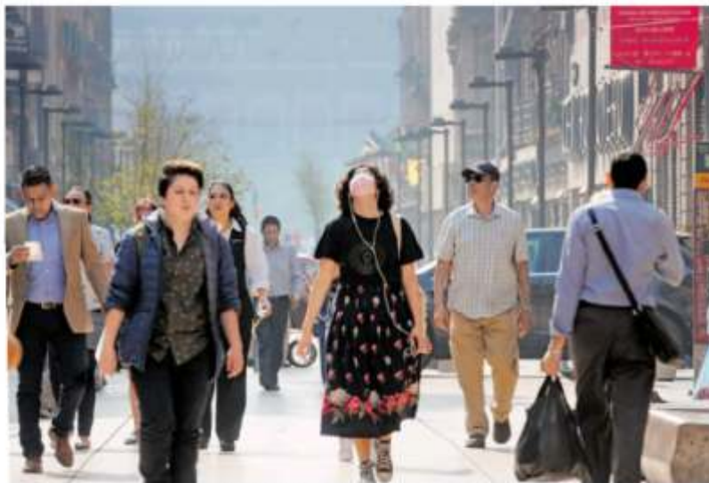
¿Ojos llorosos? Se registraron 39 incendios en la Ciudad de México ayer.

"Estamos en una situación extraordinaria dada las altas temperaturas, el incremento de los incendios agrícolas y forestales en