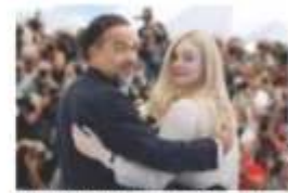
ALEJANDRO González Iñárritu y la actriz Elle Fanning, ayer, en Cannes.

El presidente del jurado del festival afirma que el cine nació para vivirse como una experiencia comunal, pero elogia a plataformas de streaming que apoyan películas que no llegarían a las salas. pág. 24