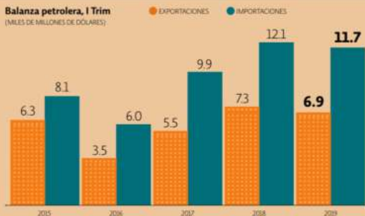
Balanza petrolera, I Trim (MILES DE MILLONES DE DÓLARES)

En el primer trimestre del año, las importaciones y exportaciones de crudo y varios productos petrolíferos entre México y sus socios comerciales registraron descensos respectivamente, lo cual mantuvo el saldo negativo de la balanza energética.