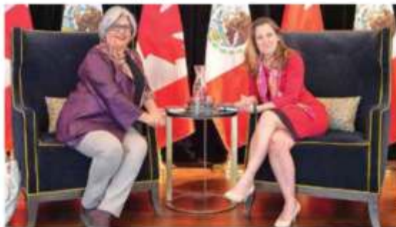
DE LOBBY. Chrystia Freeland va hoy a Washington a reunirse con Robert Lighthizer.

En Toronto, acompañada por la ministra de Asuntos Exteriores de Canadá, Chrystia Freeland, y por Jesús Seade, subsecretario para