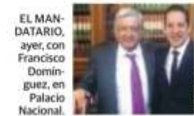
EL MANDATARIO, ayer, con Francisco Domínguez, en Palacio Nacional.

El Presidente pide al gobernador de Querétaro incluir a la IP y a sindicatos; buscan trabajar contra corrupción, ayudar para crecer a 4%, pacificar al país... pág. 7