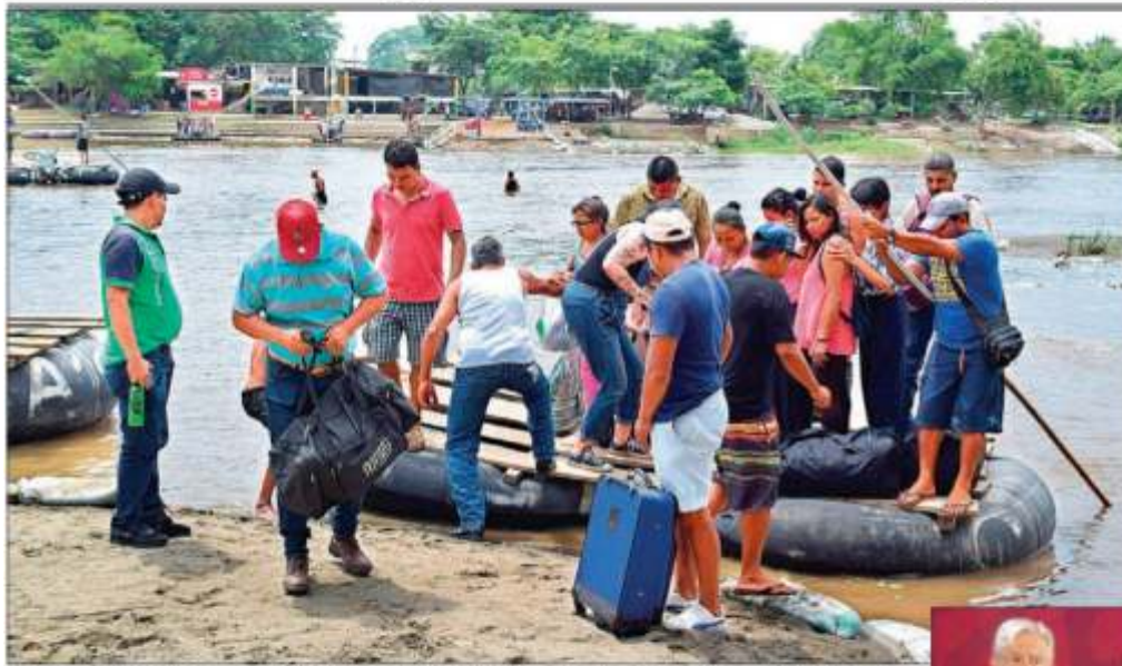
Migrantes centroamericanos cruzan el río Suchiate en la frontera México-Guatemala, el mismo día en que la CEPAL presentó un plan para desarrollar la economía regional y frenar la migración hacia Estados Unidos.