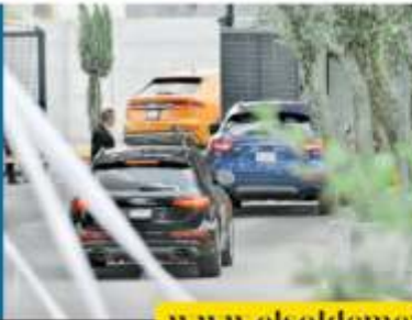
EL TIBURÓN SE QUEDA

El polémico propietario del Veracruz recibió el visto bueno de sus colegas en la reunión que se realizó en la Femexfut y finalmente validaron el pago de los 120 millones de pesos que hizo para que el conjunto jarocho siga en primera división. ESTO