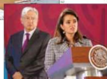
Andrés Manuel López Obrador y Margarita Ríos, directora del SAT, al anunciar la eliminación de condonaciones de impuestos.