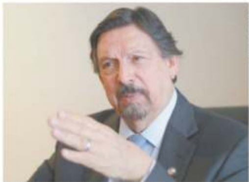
Napoleón Gómez Urrutia, senador y dirigente minero, aseguró que sus enemigos políticos gastaron 4 mil millones de dólares durante su persecución.

"Es momento de aprovechar esta coyuntura histórica y hacer las cosas con tranquilidad, en paz, sin violencia", con objeto de consolidar el nuevo modelo de política económica que México requiere, insistió. NACIÓN A8