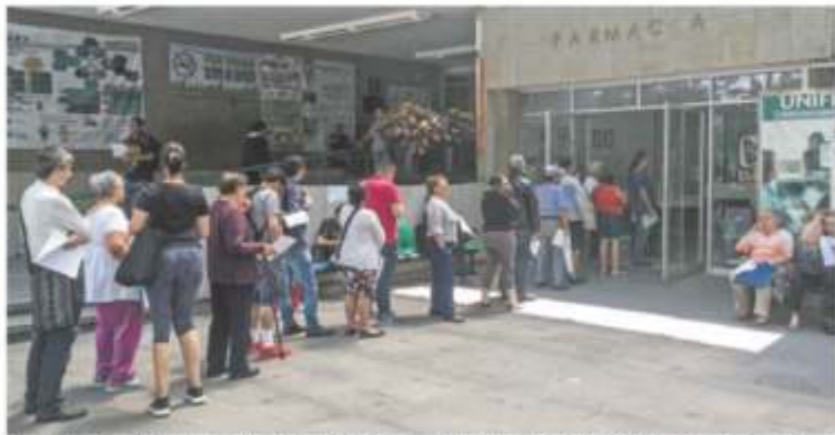
Ayer, en la Clínica 20 del IMSS, en la colonia Del Valle, se apreció una larga fila de derechohabientes en la farmacia.