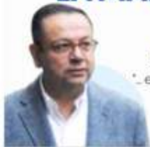
GERMÁN MARTÍNEZ CÁZARES EXDIRECTOR DEL IMSS

"... en el IMSS hay injerencias de SHCP con esencia neoliberal ahorros, recortes de personal..."