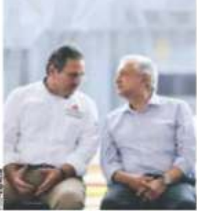
EL MANDATARIO (der.) y el director de Pemex, ayer, en el campo Itachi.