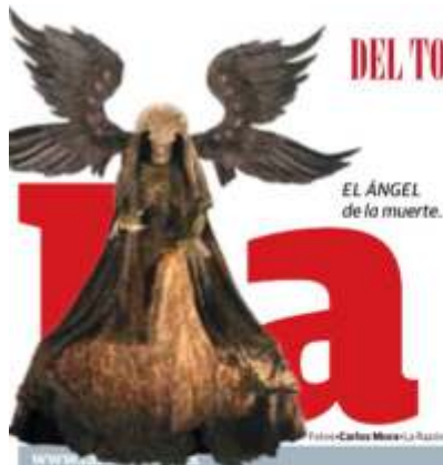
EL ÁNGEL de la muerte.