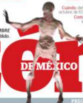
EL HOMBRE pálido.

Costa: de $50 a $180, lunes entrada libre