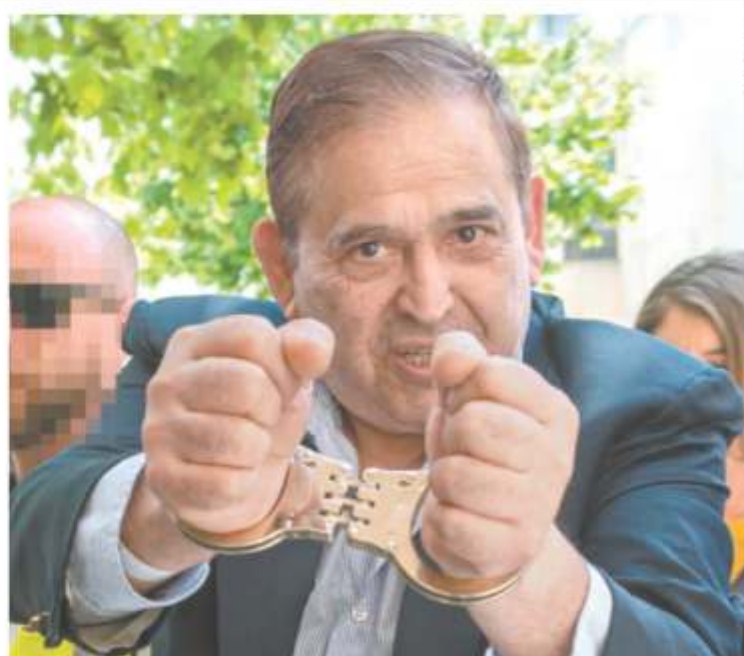
El director de Altos Hornos, Alonso Ancira, rechazó su extradición a México. Está en prisión, sin posibilidad de fianza.