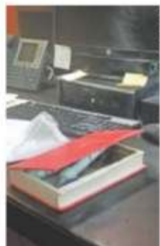
El explosivo fue entregado a la legisladora en forma de libro.