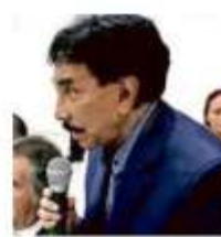
El líder ferrocarrillero habló ayer ante dirigentes obreros.