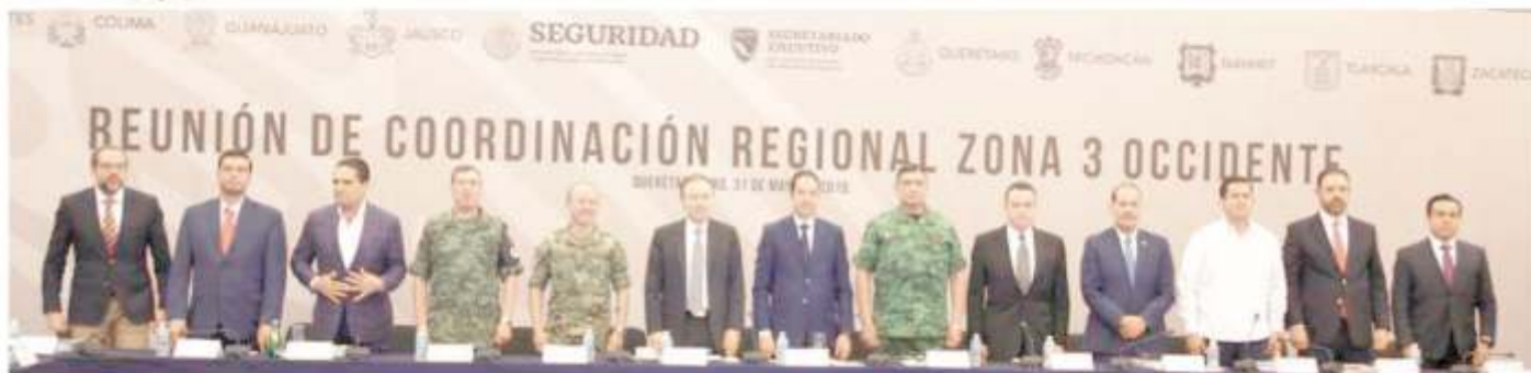
El mandatario estatal se reunió con sus homólogos de la Zona 3 Occidente y el Secretario Alfonso Durazo para evaluar y proponer nuevas estrategias de seguridad pública

Sábado 1 de Junio de 2019 Año 19 Número 6800