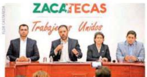
El Gobernador Alejandro Tello, en conferencia de prensa, habló del problema financiero por el que atraviesa el Estado.

Llegamos a un punto de quiebre, las cuentas del estado están en cero y se podría llegar a una parálisis operativa, por lo que en caso de no contar con apoyo se tendrán que hacer reajustes presupuestales que afectarán todos los rubros, aceptó el gobernador Alejandro Tello Cristerna, quien hizo un llamado a la federación "a que no nos abandone".