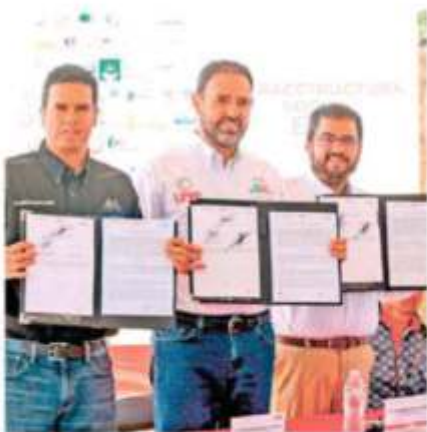
El gobernador Alejandro Tello Cristerna, presentó el programa UNE, mismo que va dirigido a la población más pobre de todo el Estado.