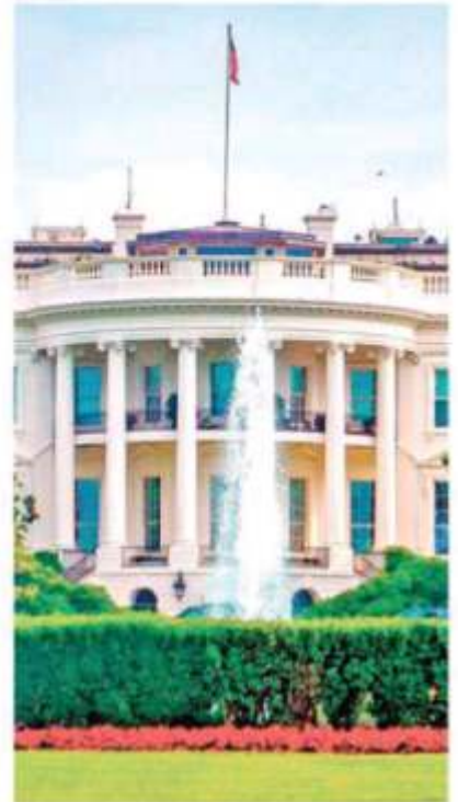
El 10 de junio se manifestarán los zacatecanos.

MIGRANTES ZACATECANOS Es el presidente más racista que han tenido los Estados Unidos de Norteamérica"