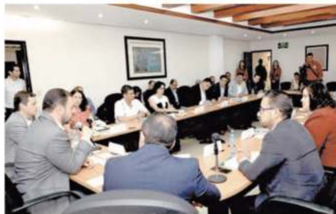
En sesión de la Junta Directiva del ISSSTEZAC, Alejandro Tello hizo entrega simbólica del decreto oficial de desincorporación del terreno para su venta