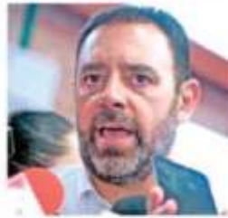
Alejandro Tello, Anuncio.

El gobernador Alejandro Tello Cristerna anunció que se ha iniciado un ordenamiento estructural a la nómina gubernamental, lo que "no quiere decir que con este proceso vaya a haber despidos, pero quizá sí va a haber algún recorte", pero que busca generar una bolsa de 350 millones de pesos en ahorros. Pág. 9