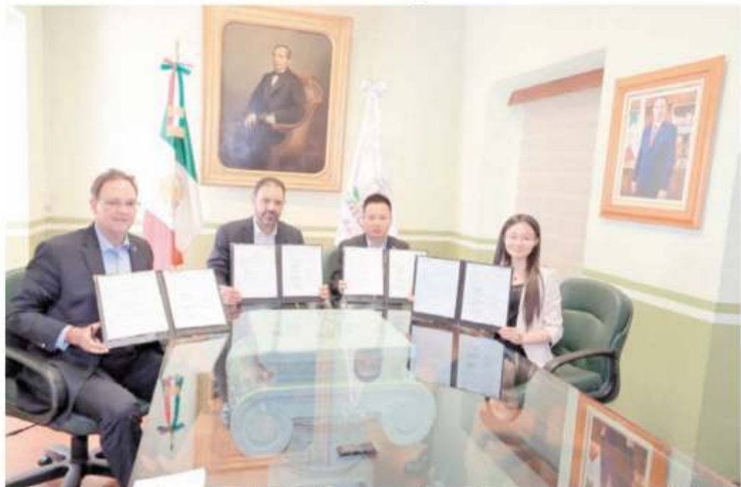
Con el acuerdo se formalizan las etapas en que China Gezhouba Group Corporation desarrollará y promocionará el Parque Industrial Zacatecas

Firman Convenio Marco Gobernador Tello y Paraestatal Asiática Para Construir el Parque Industrial Zacatecas