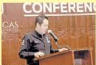
Ulises Mejía Haro, presidente municipal de Zacatecas

El Alcalde Ulises Mejía Acudirá a Saltillo Para Estudiar su Estrategia de Seguridad Pública