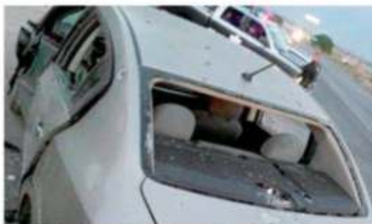
La unidad en la que viajaban los presuntos delincuentes.

Inicialmente, el incidente ocurrió cuando los oficiales de la Policía Estatal Preventiva se encontraban patrullando la carretera estatal 144, tramo Pinos - Ojuelos, donde se detectó que circulaba un vehículo de marca Nissan Sentra de color arena y totalmente polarizado. Pág. 8