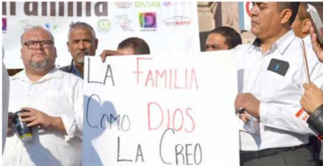
Desde temprana hora, alrededor de 20 manifestantes se dieron cita en las instalaciones del Congreso del Estado para tomar el inmueble y exigir a los diputados que no se apruebe el matrimonio igualitario en la entidad

Diputados Acceden a Realizar Foros Para Escuchar Voces a Favor y en Contra Frente Nacional por la Familia Toma Congreso del Estado Para que no Aprueben Matrimonio Igualitario