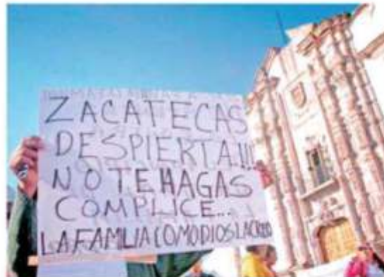
Defensores de la familia, tomaron ayer las LXIII Legislatura del Estado, por algunas horas.

Los acuerdos con el grupo de manifestantes que tomaron el Congreso del Estado, fueron que los procedimientos de dictaminación y propuestas legislativas radicadas formalmente en la Legislatura del Estado, relativas al matrimonio igualitario, se instrumenten mecanismos y políticas de parlamento abierto, a fin de que la ciudadanía sea escuchada. Pág. 8 y 9