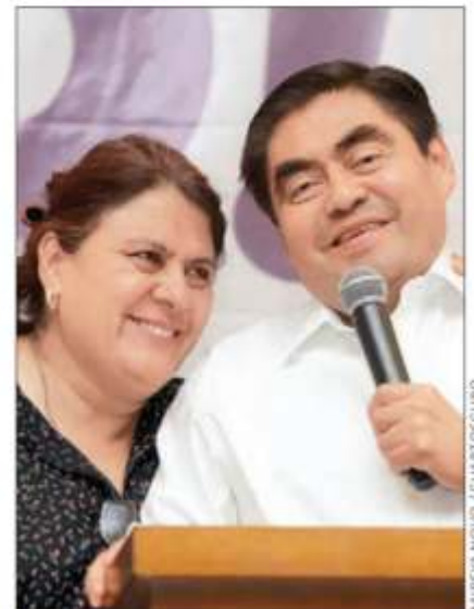
Miguel Ángel Barbosa, con su esposa, virtual gobernador de Puebla.