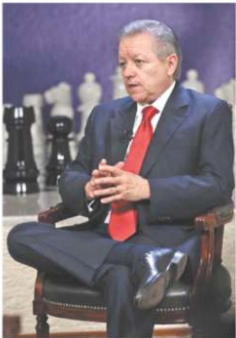
Arturo Zaldívar asegura que hay jueces y magistrados que arriesgan su vida todos los días, en un esquema de “plata o plomo”.

—Hallamos un paciente grave, con dolencias varias, pero estamos encontrando, una vez hecho un buen diagnóstico, el trata-