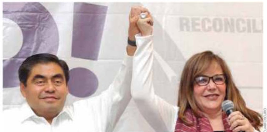
CONTIENDA. Tras el cierre de casillas en Puebla, Luis Miguel Barbosa se proclamó ganador de la gubernatura del estado.

IMPACTO SECTORIAL EMPRESAS AFECTADAS POR EL ALZA DE LAS TARIFAS COMERCIALES Y EL CONFLICTO EU-CHINA. PÁGS. 19 Y 20