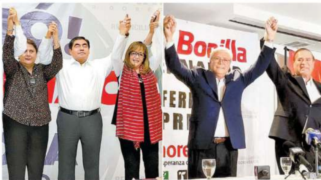
El poblanero dijo en MILENIO Tv que buscará a sus rivales. A. LOBATO