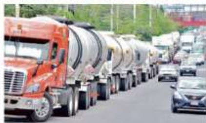
Más de 80 pipas se niegan a entregar combustible en la planta de distribución de Pemex en Cuernavaca.

Explicó que tienen una tolerancia de 90 litros faltantes por tanque, pero que los equipos de Pemex están registrando entre 200 y 250 litros menos por tanque, lo que implica descuentos de hasta 4 mil pesos para los choferes que llevan doble tanque