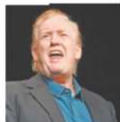
El presidente Donald Trump exige a México frenar los corraones migratorios.