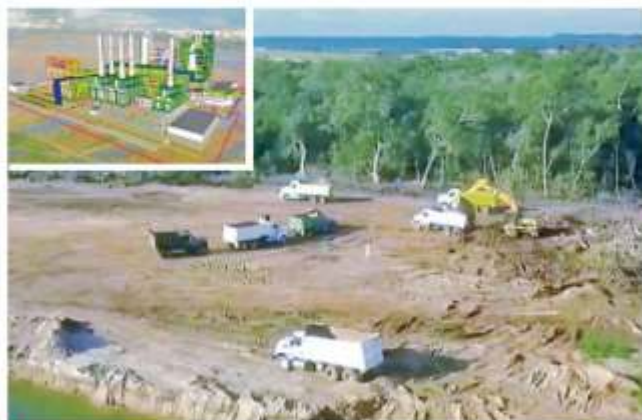
El Gobierno federal declaró ayer iniciados los trabajos de acondicionamiento de terrenos donde se construirá la refinería de Dos Bocas; arriba, la proyección de la obra terminada.

"No tiene nada que ver una cosa con otra", sostuvo. "Esta dirigencia ha trabajado intensamente en todos los municipios, distritos y estados en donde tenemos elecciones. Esta dirigencia fue electa hasta el 2021 y por lo menos estaremos hasta ahí", agregó el panista.