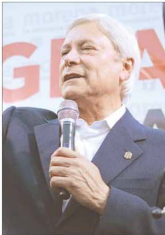
▲ Miguel Barbosa Huerta y Jaime Bonilla Valdez, candidatos de la coalición Juntos Haremos Historia a las gubernaturas de Puebla y de