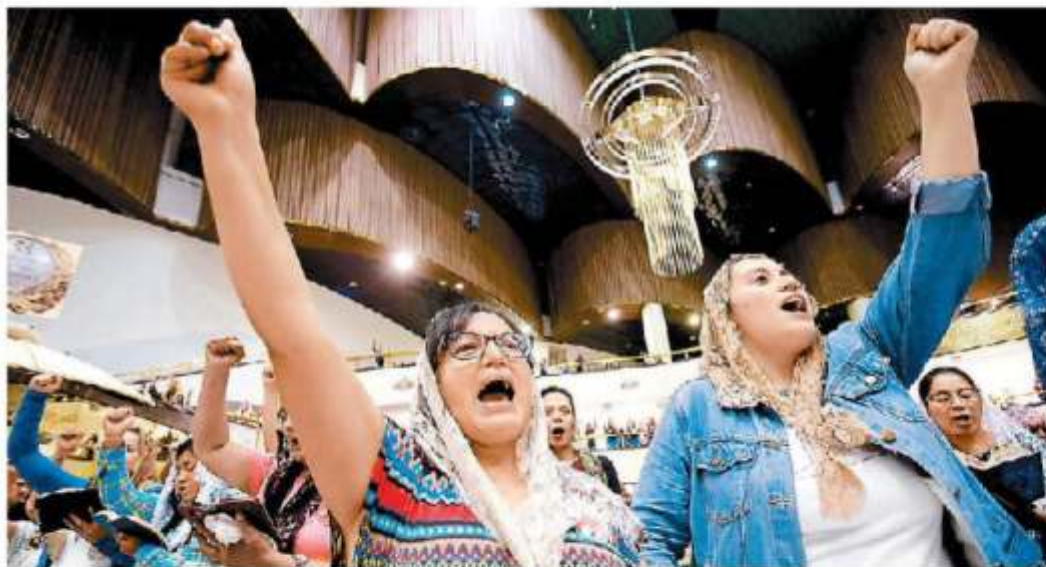
Seguidores del culto exigen la liberación del líder, Naasón Joaquín García, desde su templo en Guadalajara.