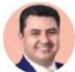
NAASÓN JOAQUÍN GARCÍA

Naasón Joaquín García es acusado de 26 delitos graves; lo señalan por tráfico de personas, violación, pornografía infantil...; le fijan fianza de 25 mdd; comunidad se congrega en sus templos a orar y niega imputaciones. pág. 7