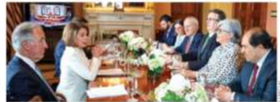
CABILDEO. El equipo mexicano se reunió en Washington con Nancy Pelosi, líder de la mayoría demócrata en la Cámara de Representantes. PÁG. 34