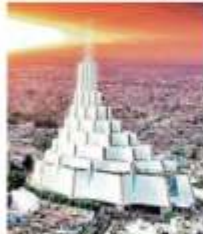
El principal templo de la Congregación está en Jalisco.

Hace unas semanas, Naoasón Joaquín estuvo en el cen-