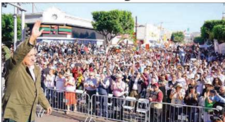
El presidente López Obrador celebró el fin de la amenaza arancelaria de Trump contenida en el acuerdo migratorio, ayer en Tijuana.

Injusto, dijo, castigar a México por proponer una solución a partir del desarrollo comercial