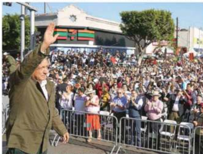
VUELVE A TOMAR LAS CALLES, COMO EN CAMPANA

Un tramo de la avenida Revolución en Tijuana fue cerrado para el acto que encabezó el presidente López Obrador. Lo acompañaron 28 gobernadores, líderes empresariales, religiosos, sociales y legisladores.