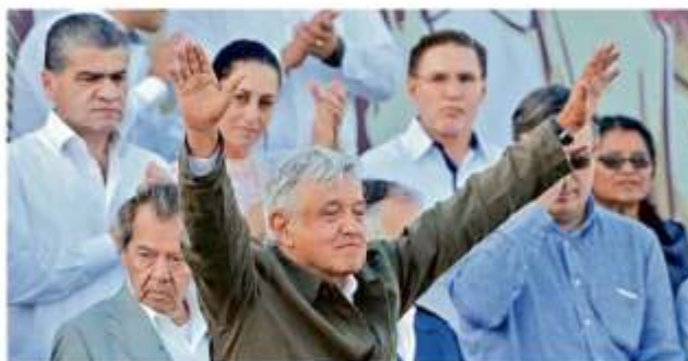
El Presidente López Obrador encabezó el acto en Tijuana, acompañado de Gobernadores, legisladores, integrantes del Gabinete y líderes religiosos.

"Empieza a disminuir la curva de dengue, y a los tres o cuatro años vuelve a presentarse un crecimiento importante. Pero es una situación que preocupa porque estamos en la época previa a las lluvias, es decir, de baja transmisión", alertó.