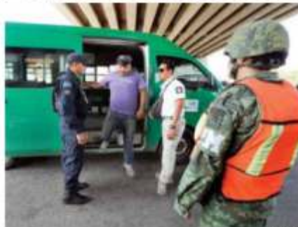
Personal del INM, apoyado por fuerzas federales, revisa a pasajeros en Tapachula, Chiapas, en busca de migrantes ilegales.