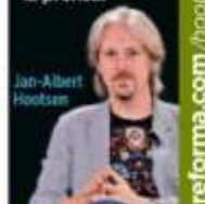
VIDEO DE LIBRE ACCESO

El representante del Comité de Protección a los Periodistas, expresa preocupación por la hostilidad contra la prensa.