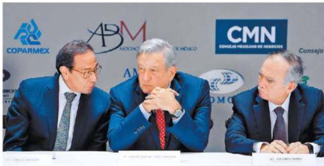
Empresarios se comprometieron con el Presidente a incrementar la inversión, pero demandaron certidumbre. ARIANA PÉREZ