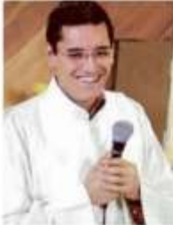
Avendaño era diácono.

Al día siguiente su familia reportó su desaparición ante la Procuraduría capi-