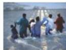
MIGRANTES cruzan el río Bravo para ingresar ilegalmente a EU, ayer.

105 Hondureños fueron retornados de Villahermosa, Tabasco, a San Pedro Sula, ayer