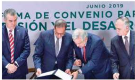
IP Y GOBIERNO. Acuerdan fomentar la inversión y el desarrollo incluyente.