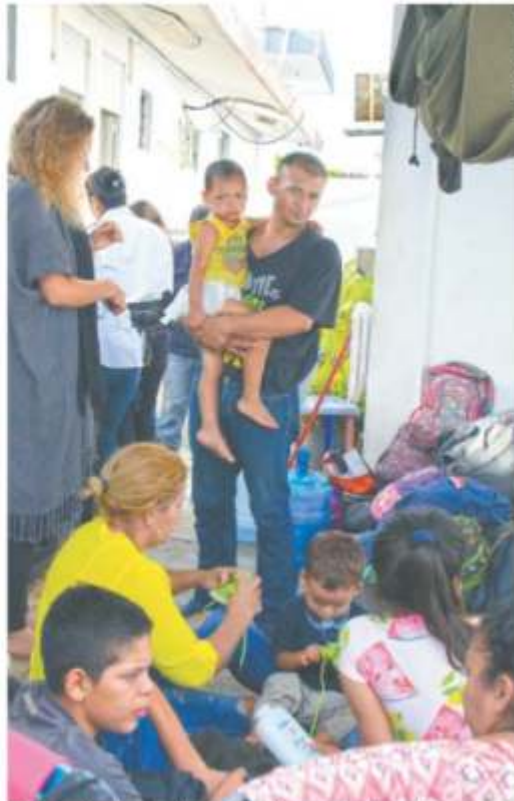
En la estación migratoria de Tenosique, Tabasco, se puede ver a hombres, mujeres y niños centroamericanos que esperan y duermen a la intemperie.