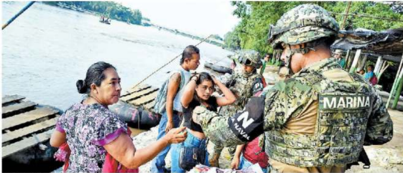
Efectivos de la Marina revisan las identificaciones de quienes cruzan el Sochiate provenientes de Guatemala.

Jordi Soler "Quizá somos el águila que huye envenenada por la serpiente" - P. 22