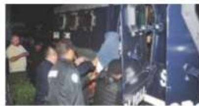
OPERATIVO en Milpa Alta, ayer, contra secuestradores.

Indagatorias revelan modus operandi de delincuentes; también se coluden con agentes, en el sur, liberan a dos personas privadas de la libertad; en caso Leonardo emiten alerta migratoria para evitar huida de sospechoso. págs. 12 y 14