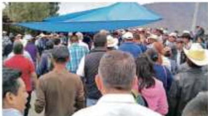
Campeños bloquearon ayer la carretera Tiapa-Chilapa para exigir fertilizante en zonas donde hay cultivo de ensenantes.

A seis meses del nuevo Gobierno, el gasto en construcción se queda corto. Sólo se ha contratado el 19% de lo aprobado en el Presupuesto. NEGOCIOS 5