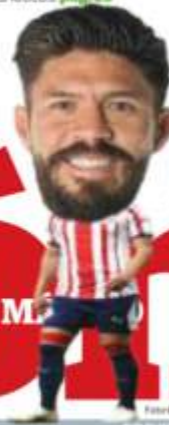
ORIBE PERALTA 2019