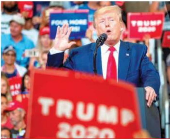
El presidente de Estados Unidos, Donald Trump, al iniciar ayer en Orlando, Florida, su campaña para buscar la reelección en 2020.

Trump inicia campaña de reelección con ataques a demócratas y migrantes