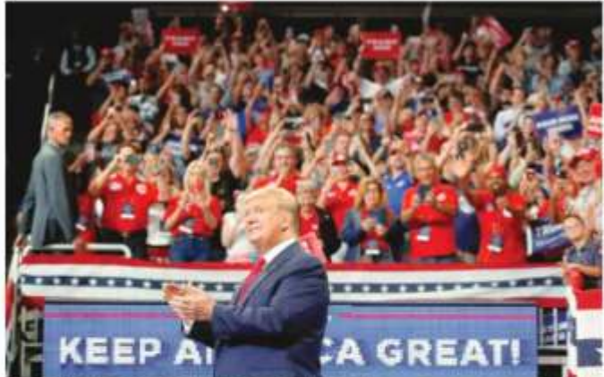
TRUMP INICIA CAMPAÑA RUMBO A LA REELECCIÓN