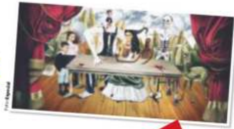
La mesa herida Autor: Frida Kahlo Sestravelli. En Polonia, en 1955

Un sujeto pretende certificar en Morelos un contrato de compra-venta del lienzo La mesa herida de la artista mexicana; se desconoce si el documento es real y el paradero de la obra. pág. 24