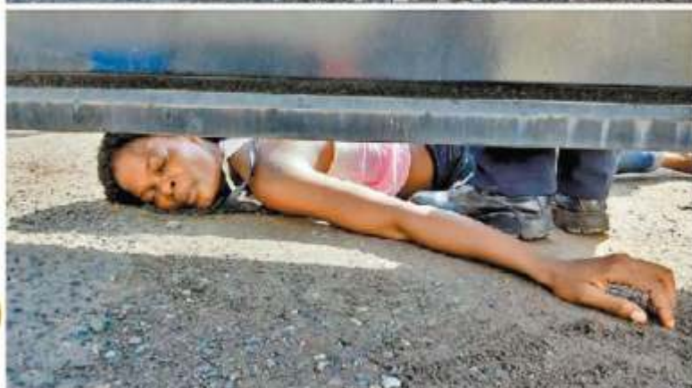
Una haitiana protestó por las condiciones en una estación de Tapachula.