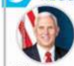
Mike Pence @VP

"México mantiene su promesa y ahora envía 15 mil soldados a la frontera para ayudar con la crisis. Mientras tanto, los demócratas no financiarán camas para niños migrantes. México sigue haciendo más que los demócratas para asegurar la frontera, ¡es hora de dar un PASO ADELANTE!"