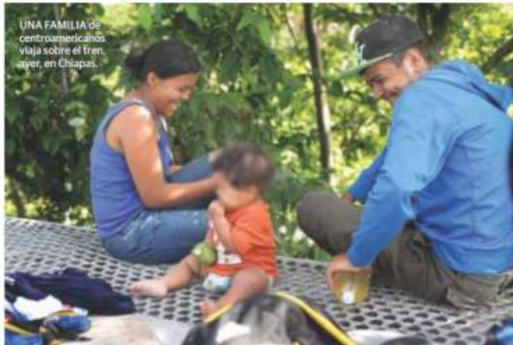
UNA FAMILIA de centroamericanos viaja sobre el tren aver, en Chiapas.

• El Presidente adara que las fuerzas federales pueden detener a migrantes, pero "esa no es la instrucción"; devuelve EU a 15 mil. págs. 3, 4 y 22