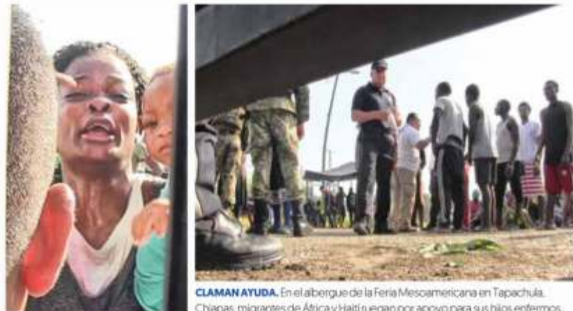
CLAMAN AYUDA. En el albergue de la Feria Mesoamericana en Tapachula, Chiapas, migrantes de África y Haití ruegan por apoyo para sus hijos enfermos.

ECATEPEC. El presidente prometió 600 millones de pesos. Anunció un programa de mejora para colonias; aun así, él y Alfredo del Mazo recibieron rechiflas.