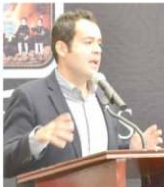
Ulises Mejía Haro, presidente municipal de Zacatecas