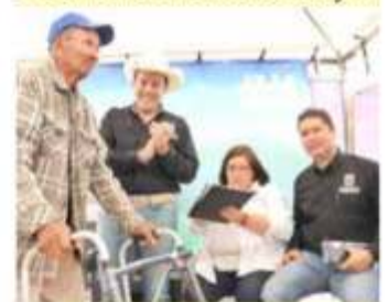
Esta audiencia, anunció el municipio, es la número 32 realizada por la actual administración