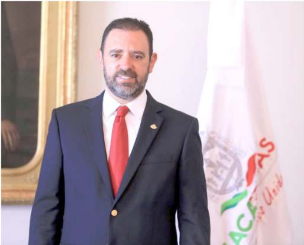
Reconoce el trabajo realizado por el ex Secretario Carlos Urzúa, quien fue un aliado del estado