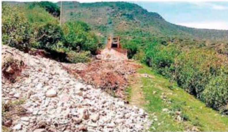
El gobierno Federal, a través de la Conagua, canceló el apoyo económico para el proyecto Milpillas.

El gobierno federal, a través de la Comisión Nacional del Agua, anunció el retiro de la segunda inversión programada para 2019, por el orden de los 504 millones de pesos que se contaban en reserva en el Presupuesto de Egresos de la Federación (PEF) para la presa Milpillas, ante lo cual el Gobierno del Estado señaló no tener un comunicado oficial al respecto y que el proyecto sigue en pie. Pág. 9