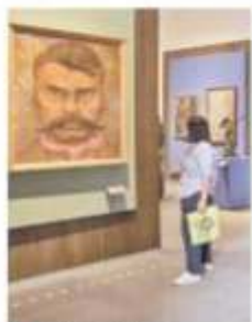
La Galería Nacional estuvo abierta desde 2010.

Los cambios ocurren a la par del anuncio de que el Presidente Andrés Manuel López Obrador no sólo desparejará en Palacio Nacional,