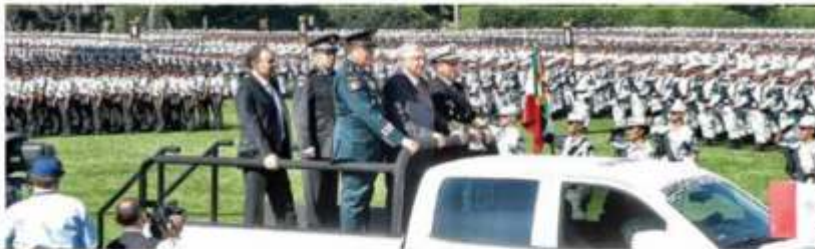
GUARDIA NACIONAL. El mandatario encabezó el despliegue de 70 mil elementos en 150 regiones del país.