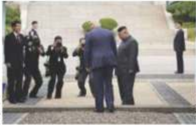
TRUMP Y KIM, ayer, en la zona desmilitarizada que une a los dos Corea.