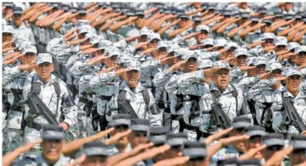
El presidente encabezó en el Campo Marte el acto para el despliegue de 70 mil elementos en 150 regiones del país. ARIANA PÉREZ