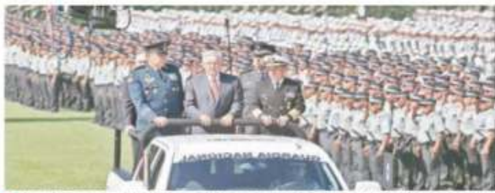
El Presidente pasó revista desde una de las camionetas de la Guardia Nacional, las cuales fueron pintadas de blanco y azul marino, con el escudo de un águila.

Nueva York vence por segunda ocasión a Boston y lo barre 2-0 en la histórica serie de Grandes Ligas jugada en Londres.