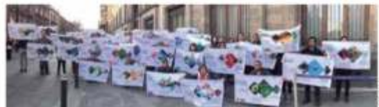
ECOS DE LA AUSTRIDAD. Científicos del Cinvestav pidieron a AMLO reconsiderar

forma discrecional. El artículo 61 de la Ley de Presupuesto dice que el Ejecutivo podrá determinar el destino de los ahorros generados. — Eduardo Ortega / PÁG. 30