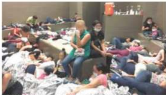
SATURACIÓN en un centro de detención en el sur de Texas.

• Arman protestas en 180 puntos de la Unión Americana tras difusión de imágenes de hacinamiento en centros de detención; supervisores documentan personas sin ducha durante un mes, niños retenidos más de 72 horas... pág. 4