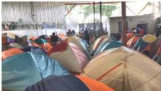
EL ALBERGUE Juventud 2000, en Tijuana, a su máxima capacidad.

• Pelegra estancia de 130 indocumentados; retiran apoyo estatal a Juventud 2000 que arrastra deudas de renta, luz, gas, agua...; el Presidente celebra reconocimiento de Trump por disminución de flujo migratorio págs. 3 y 4