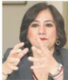
Irma Eréndira Sandoval, titular de la Función Pública.