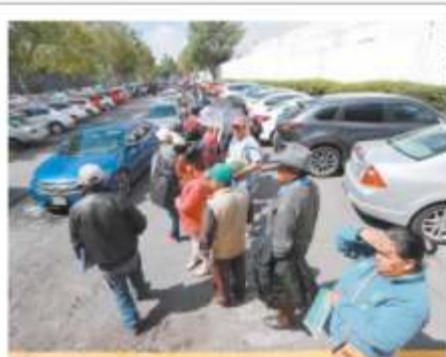
Largas filas afuera de la oficina de Servicios Administrativos en Toluca. Personas arribaron desde las 05:00 horas de ayer.