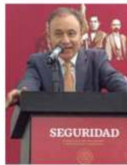
CANCELAN BONO. No hay razón para mantener el pago, dijo Durazo