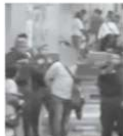
Un video muestra la detención de El Chocorrol en el Metro.