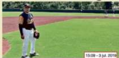
Andrés Manuel @lopezobrador_ Hoy tuve tiempo de ir a practicar béisbol;

Una hora antes se dio tiempo de practicar béisbol en CU, donde "fildeó" y "mucameó".