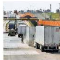
Serán 22 de 44.

La propuesta es que personal militar en retiro ocupe altos cargos "para inhibir las actividades de corrupción". PÁG. 10