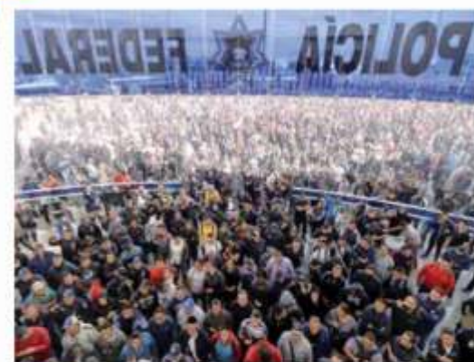
REBELIÓN. Desde las 3 de la madrugada se concentraron en la corporación.