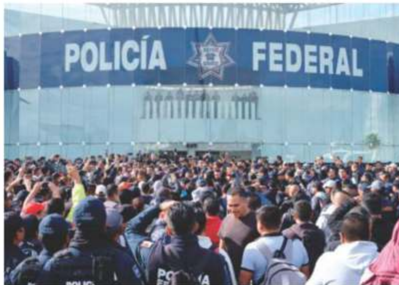
POLICÍAS FEDERALES tomaron el Centro de Mando en Iztapalapa, ayer.

36 Mil efectivos tiene la PF 16 Mil elementos de PF, para la Guardia 9 Mil acreditados de dos cuerpos