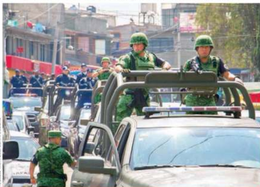
Militares integrantes de la Guardia Nacional, con un brazalete de la GN, fueron desplegados ayer en la colonia Desarrollo Urbano Quetzalcóatl, considerada la más peligrosa de Iztapalapa. La jefa de Gobierno, Claudia Sheinbaum, encabezó el arribo del nuevo cuerpo policiaco, el cual tendrá 450 elementos en total en esa alcaldía. 10