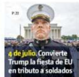
4 de julio. Convierte Trump la fiesta de EU en tributo a soldados