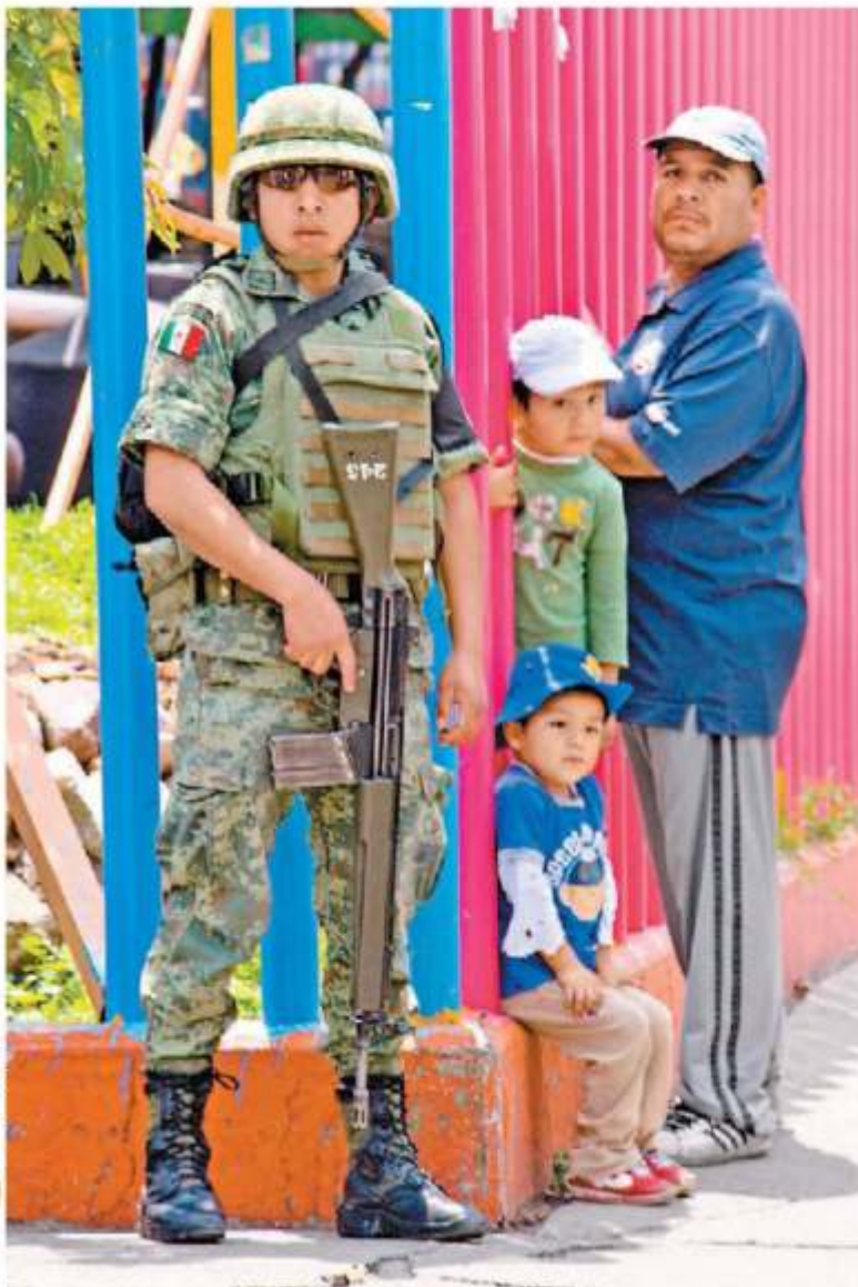
Después de tres días, la Guardia ya fue desplegada en Iztapalapa.