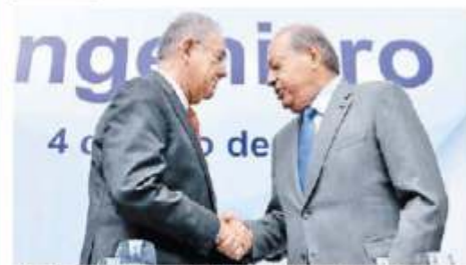
Jiménez Espriú y Slim en el Día del Ingeniero.