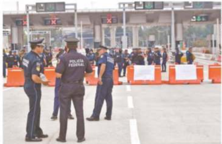
Policías federales tomaron la caseta de Tlalpan y evitron el paso vehicular; posteriormente fue liberada.