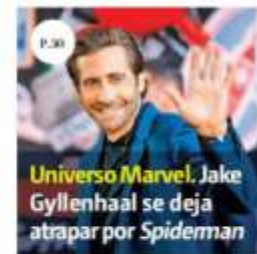
Universo Marvel. Jake Gyllenhaal se deja atrapar por Spiderman