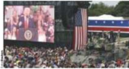
EL MAGNATE, ayer, con su exhibición militar en Washington.

El presidente exalta a las Fuerzas Armadas como lo más grande de EU; llama a la unidad en momentos de frágiles equilibrios que amenazan la paz mundial. pág. 31