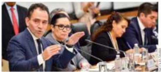
A FAVOR. Avanza ratificación de Arturo Herrera como secretario de Hacienda.