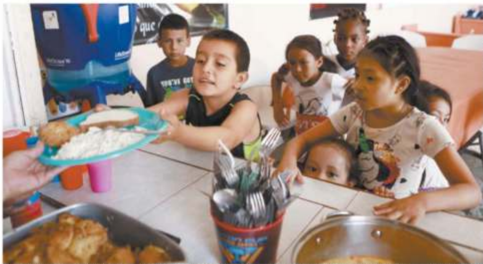
Niños migrantes se frenan para recibir comida en el albergue El Buen Samaritano, en Ciudad Juárez. No saben cuánto durará la espera para viajar a EU.

IBETH MANGENAS Corresponsal —imangen@eluniversal.com.mx