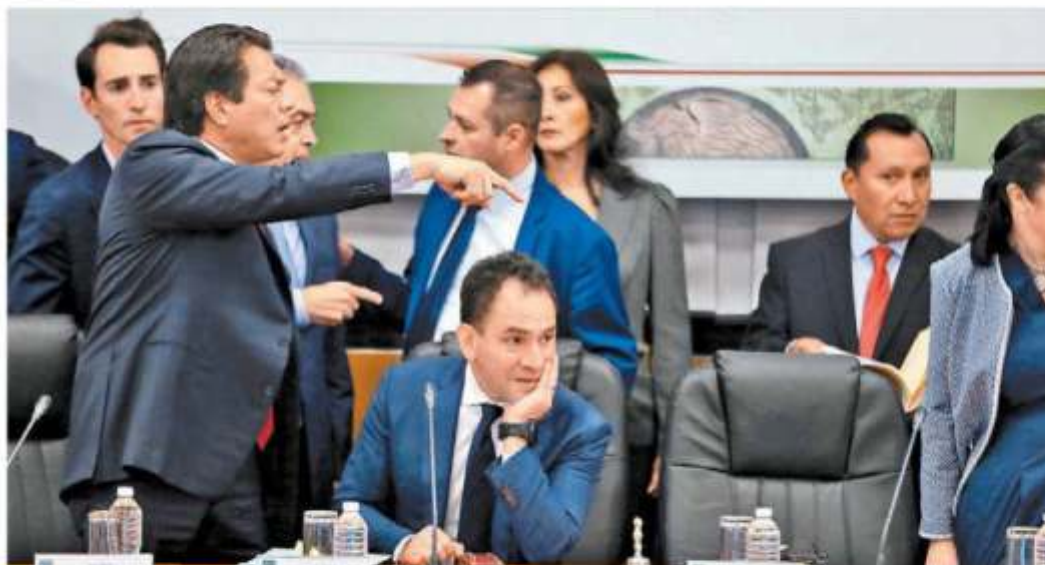
En su primera cita con diputados, el secretario de Hacienda expresó su apoyo a los proyectos del Presidente. JAVIER RÍOS

Reporte de la Fematur Destinos de QR, con caída en ocupación por sargazo ROBERTO VALADEZ - PAG. 21 Y 22