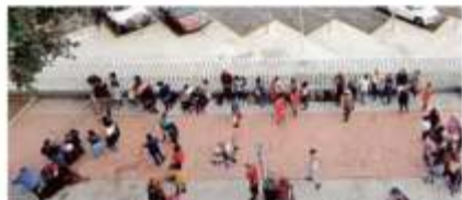
Migrantes esperaban ayer ser atendidos en Tijuana.

Además indicó que los trabajadores petroleros deberán mejorar sus condiciones laborales y prestaciones.