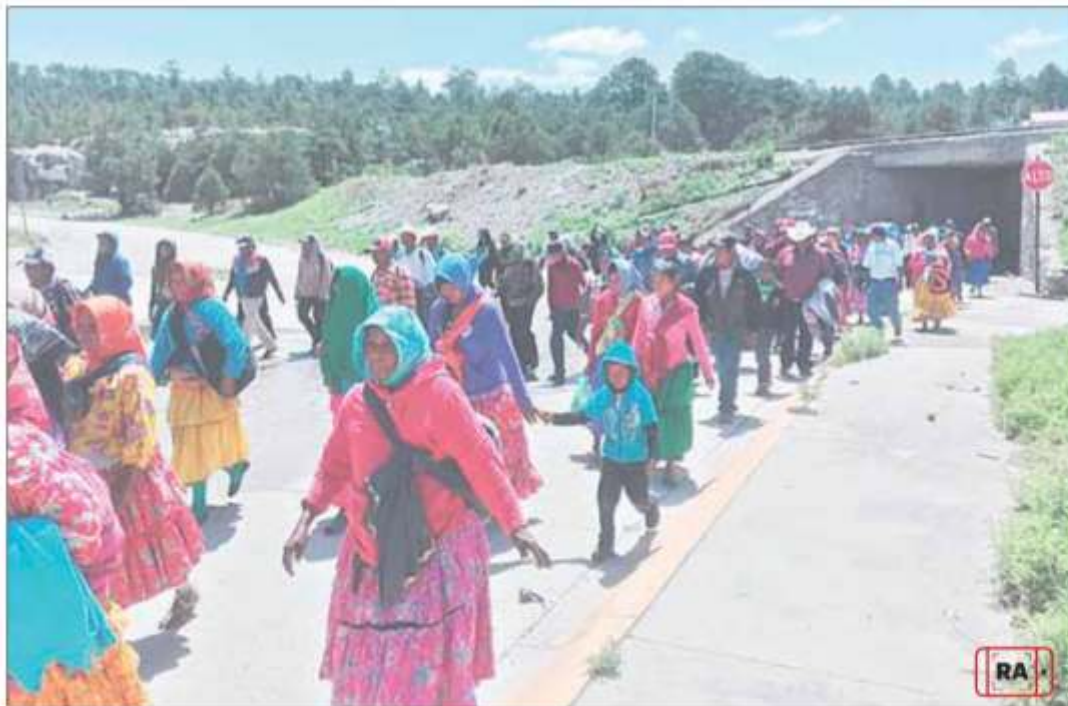
▲ Unos 200 indígenas de la sierra Tarahumara se dirigen a la ciudad de Chihuahua para demandar a las autoridades que los incluyan en el programa Sembrado Vida y recibir los mismos apoyos que se otorgan a campesinos y ejidatarios del sur del país. La Secretaría de Desarrollo

local dijo que la región padece una situación de “hambrea crónica” que se agudizó por la falta de lluvias para cultivos de autoconsumo. Los inconformes denunciaron que los excluyeron de apoyos oficiales. / P 29