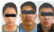
Los detenidos pertenecen a la Policía Militar.

● Agentes del Edomex y Guerrero los detienen y los acusan de integrar una banda de plagiaros