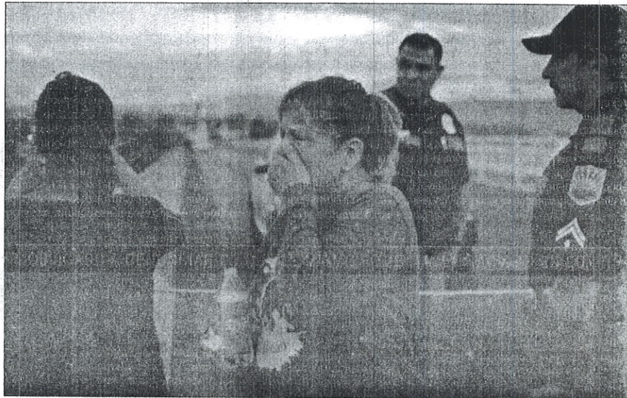
Muere un mexicano más en Texas y ya suman 8

Muere un mexicano más en Texas y ya suman 8. (18:25 p.m.)■