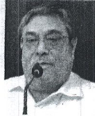
CARLOS PAVÓN CAMPOS, diputado federal.

entendió que la constancia es vital para mantenerse vigente. A ambos les ocurrió la amarga experiencia de recibir muchas llamadas y manifestaciones de apoyo, pero al darse a conocer los resultados electorales muchos ingratos ya no se acordaban de ellos.