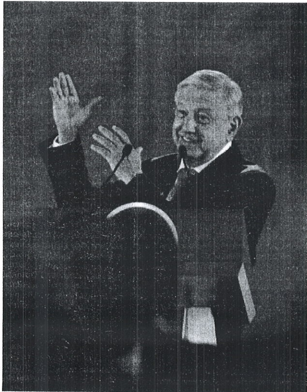
AMLO reiteró que no aumentarán ni se crearán nuevos impuestos para 2020

Reiteró que el presupuesto previsto para el año entrante será suficiente y que no habrá nuevos impuestos y tampoco se incrementarán. ■