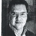
Coralillo