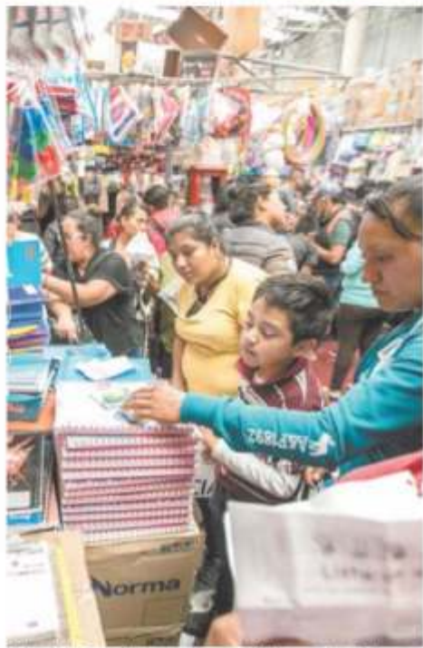
Padres de familia se definen entre puestos y locales que ofrecen lápices, cuadernos, mochilas y todo lo que los niños necesitan para regresar a clases.