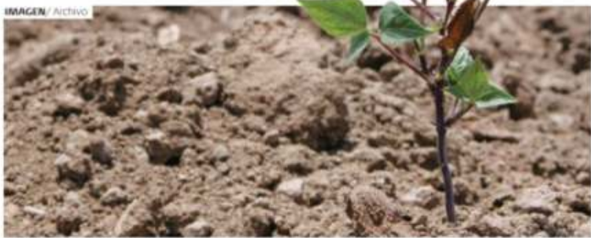
DEBIDO A LA FALTA DE LLUVIAS los cultivos no se alcanzaron a desarrollar