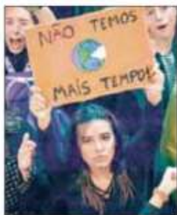
▲ Cientos se manifestaron en sedes diplomáticas de Brasil. La imagen, en Rio de Janeiro.

de militar y "usó un chaleco que le quedaba grande; parecía el comandante Borolas". El ex mandatario respondió que a él no le queda el saco, mientras a otros "el cargo les queda grande". ALMA E. MUÑOZ / P 3