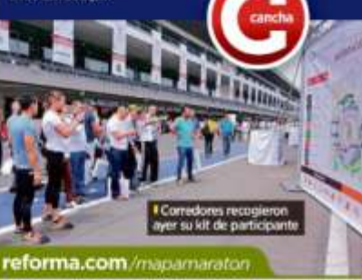
Corredores recogen ayer su kit de participante