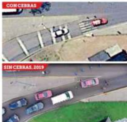
El masfaltado borró los señalamientos del paso peatonal en el trébol de Insurgentes y Periférico.