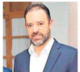
Alejandro Tello Cristerna. Ya piensa en su futuro.

Ataviado en un traje negro y camisa blanca, el mandatario estatal, sostuvo que viene un golpe de timón para los años restantes en su gobierno y advirtió que “vienen cambios” en los integrantes su administración, porque quiere cerrar bien en su administración... Quiere cerrar fuerte, dijo. Pág. 6