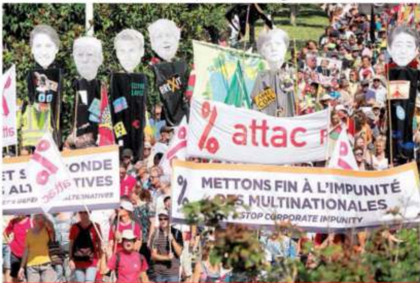
La tensión entre China y Estados Unidos precedió el arranque de la Cumbre en Biarritz, Francia.