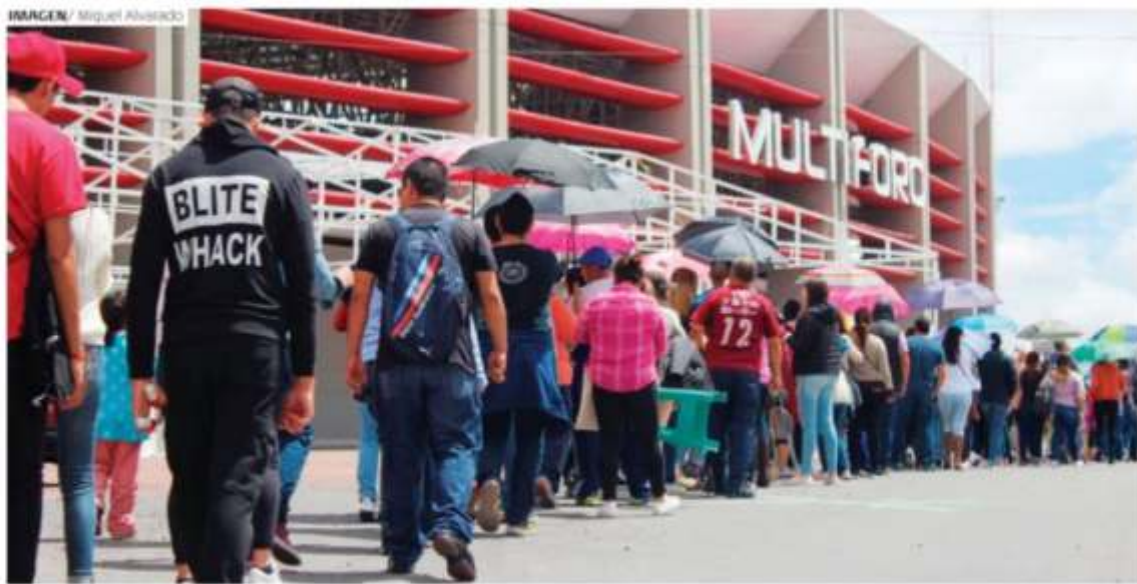
FILAS INTERMINABLES de personas que acamparon desde el viernes por la noche para comprar sus boletos.