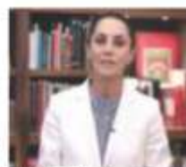
CLAUDIA Sheinbaum, ayer.

La Jefa de Gobierno plantea 5 ejes para apoyar a alumnos de nivel básico; les dan $330 mensuales; "que sepan que nos importan", dice. pág. 15