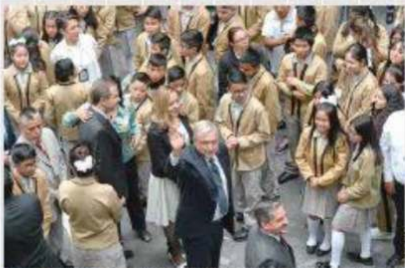
INGRESO. Archibio Manuel López Obrador dio inicio al ciclo escolar y dijo que se van a pagar 7 millones de libros de texto.

La secretaria de la Comisión de Educación de la Cámara de Diputados aseguró al Fovoco que el PRI de la sesión un paquete de "oposición maliciosa y responsable". Morena prevé llevar su semana a la Comisión Permanente las lecturas, "mayoritario" y aprobar en comisiones el 2 de septiembre, y el 1 de septiembre podrá votar en el pleno. — reforma / IAG. 36