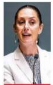
Claudia Sheinbaum: La beca ya no será sólo para niños y niñas talento, sino generalizada