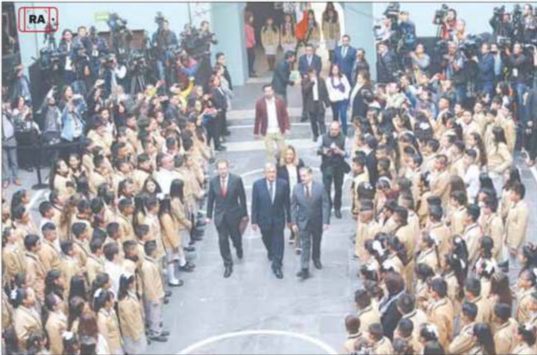
▲ El presidente Andrés Manuel López Obrador encabezó la ceremonia de inicio del ciclo escolar 2019-2020 en la Secundaria Técnica 63 Melchior Ocampo, ubicada en el Centro Histórico. Destacó que, en el