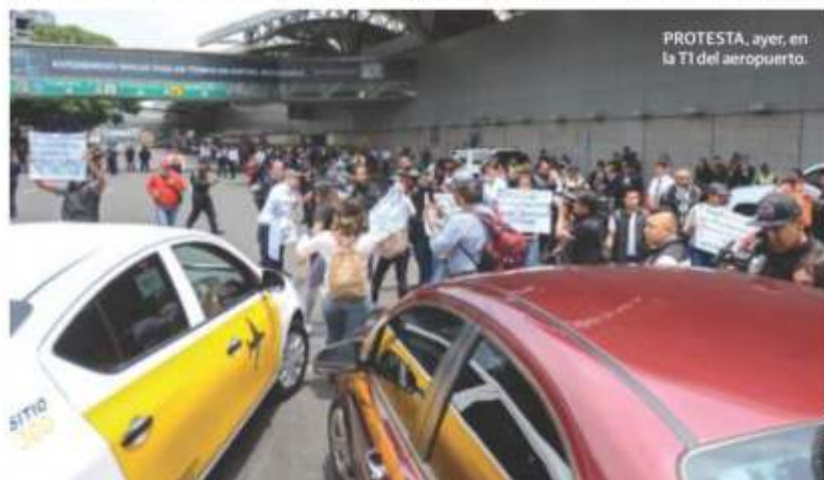
PROTESTA, ayer, en la TI del aeropuerto.

Al grito de ¡no más niños muertos!, padres de menores con cáncer cierran acceso vehicular y generan caos vial; viajeros llegan a pie a la terminal aérea, protestan porque en el hospital Federico Gómez no les han brindado tratamientos y pueden recaer. Salud pide préstamo al IMSS y garantiza que los pacientes contarán con medicina pág. 8