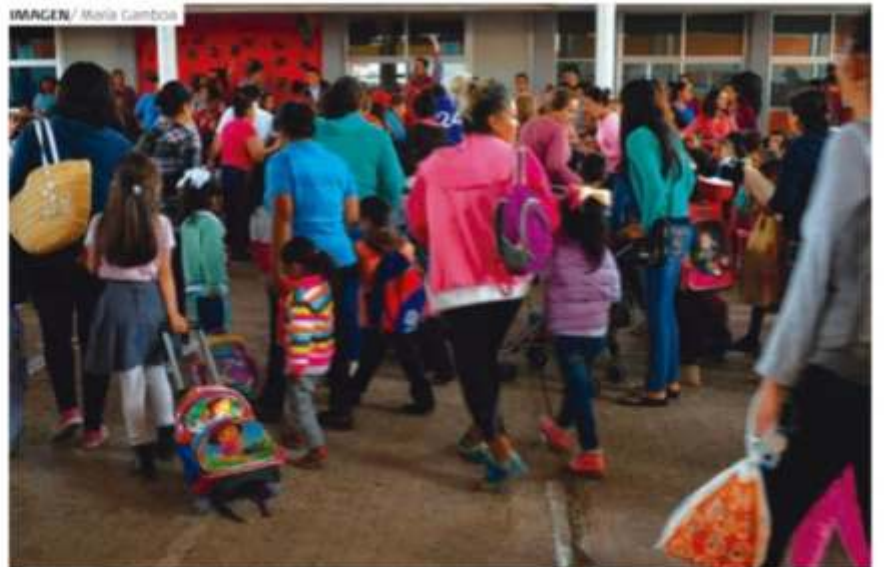
IMAGEN / María Cambos