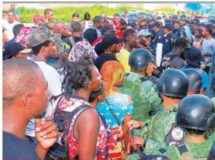
Migrantes africanos protestan en las afueras de la Estación Migratoria Siglo XXI, en Tapachula, Chiapas, por el retraso en la entrega de un permiso oficial para cruzar el país.