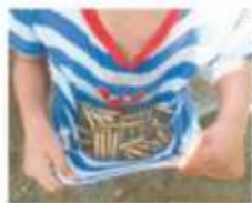
Después del tiroteo, algunos niños recogieron los casquillos tirados.