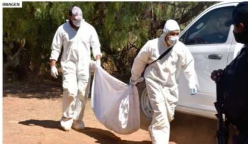
LOS MUNICIPIOS LEJANOS A LA CAPITAL encabezan el número de fosas clandestinas