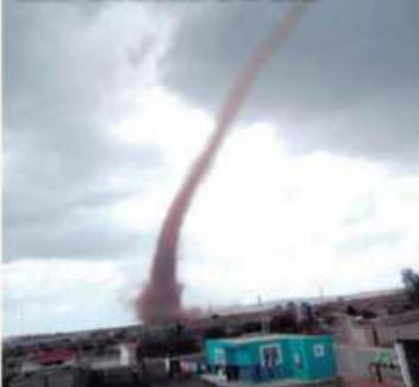
FRESNILLO. La tarde de este martes se registró un fenómeno poco común, un remolino con categoría de tornado de baja densidad que causó conmoción entre la población. STAFF C-A