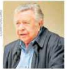
ELABORACIÓN: JUAN CASTRO

Diputados de la LXIII Legislatura del Estado propusieron al maestro Manuel Felguérez, como Ciudadano Benemérito de Zacatecas. Pág. 8