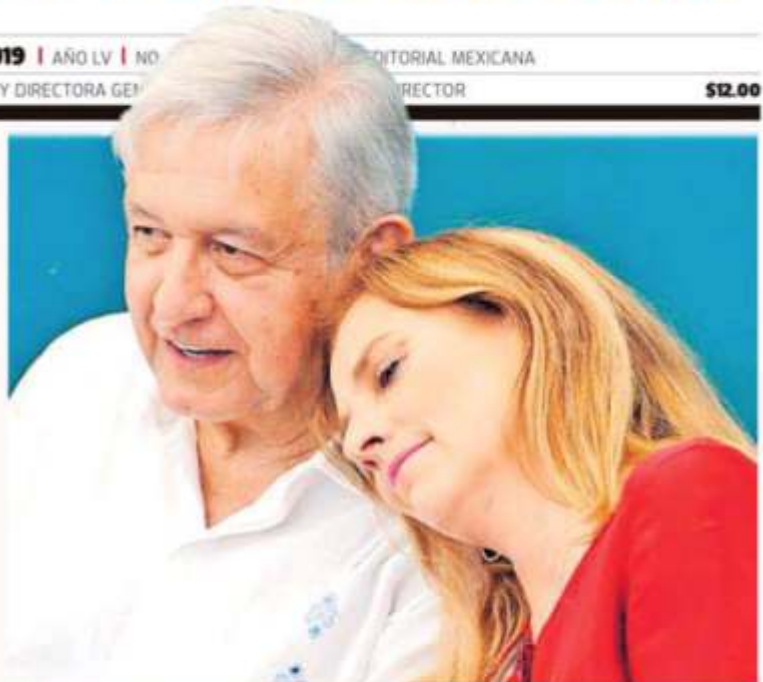
Beatriz Gutiérrez Müller, esposa de Andrés Manuel López Obrador, se recargó en el hombro del presidente por unos segundos, durante la gira de trabajo por el municipio de Villanueva.