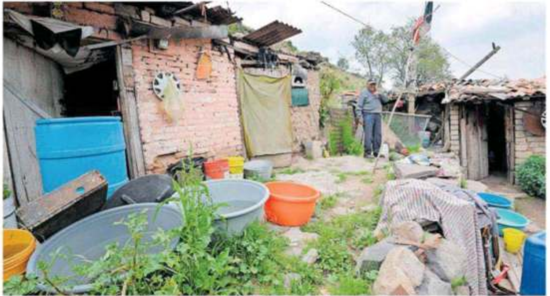
La pobreza en Zacatecas continúa siendo uno de los retos y desafíos más complicados de vencer.

Nueva regla descalifica a la mitad de quienes soliciten diferentes tipos de visa por ser demasiado pobres. Pág. 23