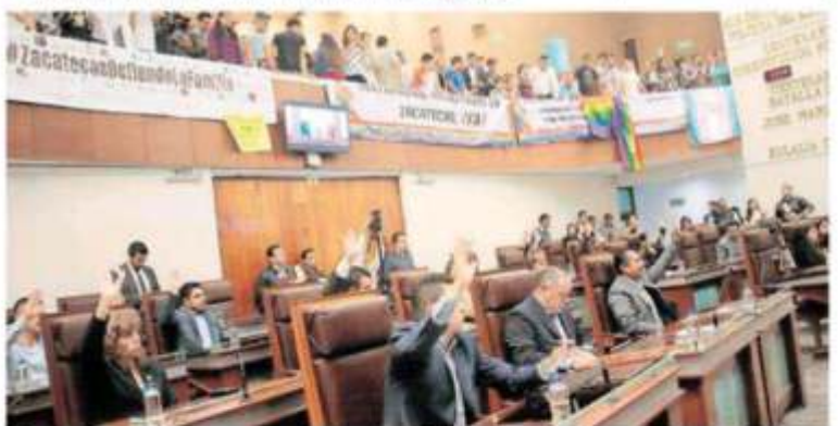
Momento en que 26 diputados presentes en la LXIII Legislatura del Estado votaron a favor o en contra del polémico tema del matrimonio igualitario.

legisladores votaron a favor del dictamen.