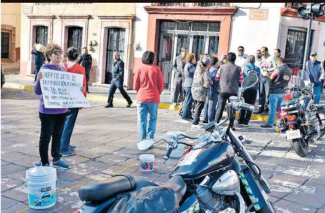
Habitantes del centro histórico bloquearon varias avenidas para exigir el servicio de agua potable, luego de varios días que no se les suministra. Este mismo mes la Jiapaz podría incrementar las tarifas hasta un 10 por ciento, lo que ha causado malestar.