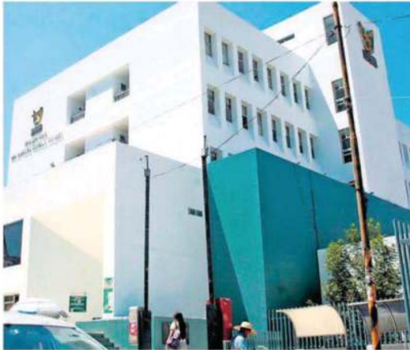
La delegación del IMSS anunció nuevas medidas de cobro para instituciones deudoras. EL SOL DE ZACATECAS

Cabe señalar que con un pasivo de 122 millones de pesos, el Colegio de Bachilleres del Estado de Zacatecas (Cobahetz) es el subsistema educativo estatal con el mayor pasivo, según datos de la delegación del Instituto Mexicano del Seguro Social. Pág. 8