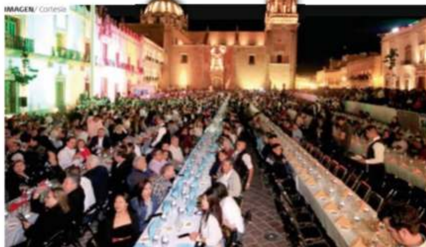
ZACATECANOS se reunieron en la plaza de armas para apoyar al estado.