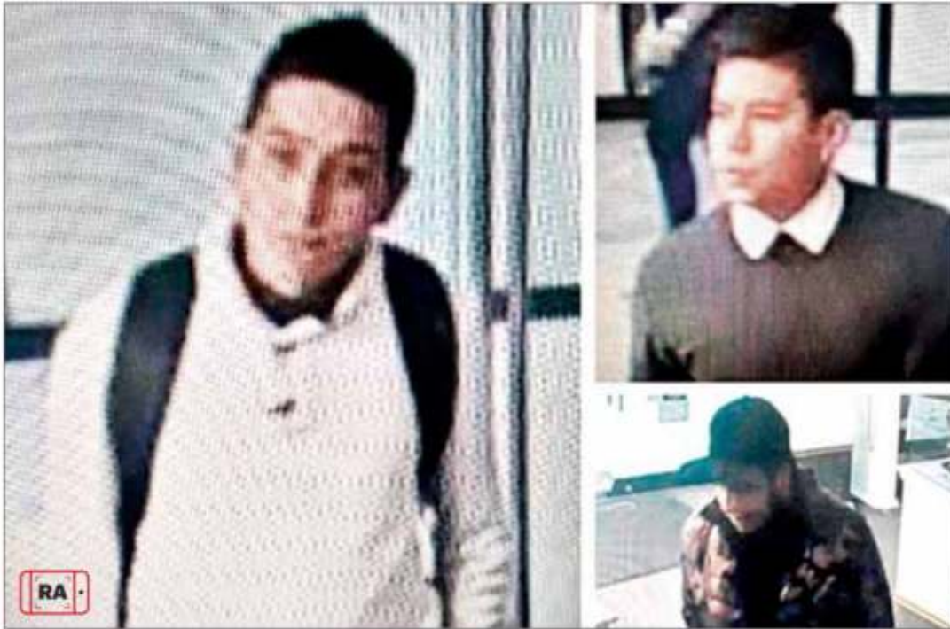
▲ Imágenes captadas por las cámaras de seguridad de la Casa de Moneda de México de los tres sujetos que ayer asaltaron el inmueble, dependiente de la Secretaría de Hacienda y Crédito Público, ubicado