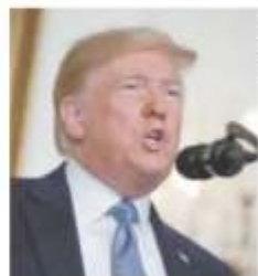
El gobierno mexicano siguió de cerca la candidatura de Trump.

"Se prevé una baja en la colaboración de agencias estadounidenses para ayudar a disminuir el tráfico de armas hacia México, así como el intercambio de información, dada la presión de la industria armamentista al gobierno [de EU]", indicó el Centro de Investigación y Seguridad Nacional (Cisen).