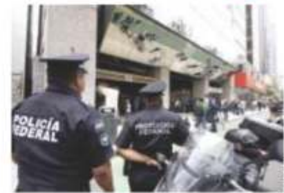
OPERATIVO policiaco, ayer, tras el atraco.

Ingresan tres sujetos armados y se llevan 1,567 centenarios y relojes; el saqueo se realizó en sólo 8 minutos; indagan a dos empleados y a un guardia pág. 7