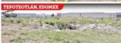
Los hospitales cancelados no comenzaban a construirse.