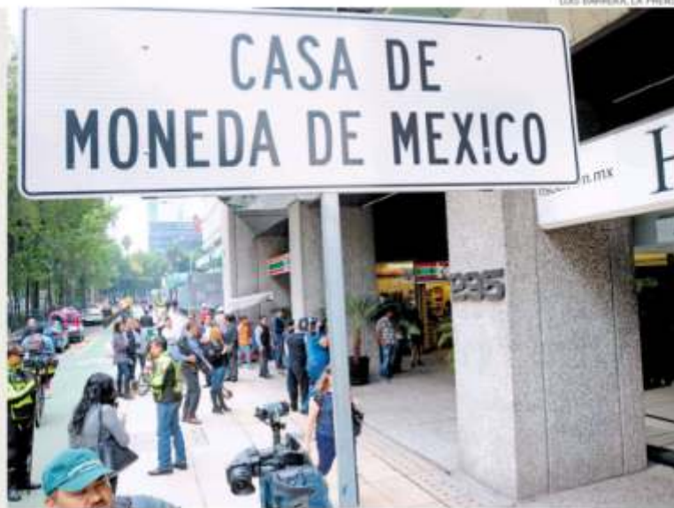
LEO BARRERA, LA PRENSA

Ayer asaltaron la sucursal de Reforma de la Casa de Moneda. Llegaron a bordo de motocicletas, rápidamente le quitaron su arma al único vigilante y sometieron a empleados del lugar. Luego se apoderaron de mil 567 centenarios, lo que representa alrededor de 50 millones de pesos. Tres individuos saquearon la bóveda y la vitrina, de donde tomaron monedas y relojes conmemorativos, las cuales metieron en una mochila. Pág. 25