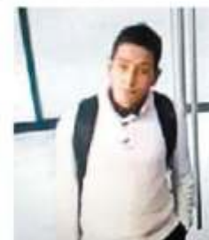
Uno de los implicados. ESPECTADOR