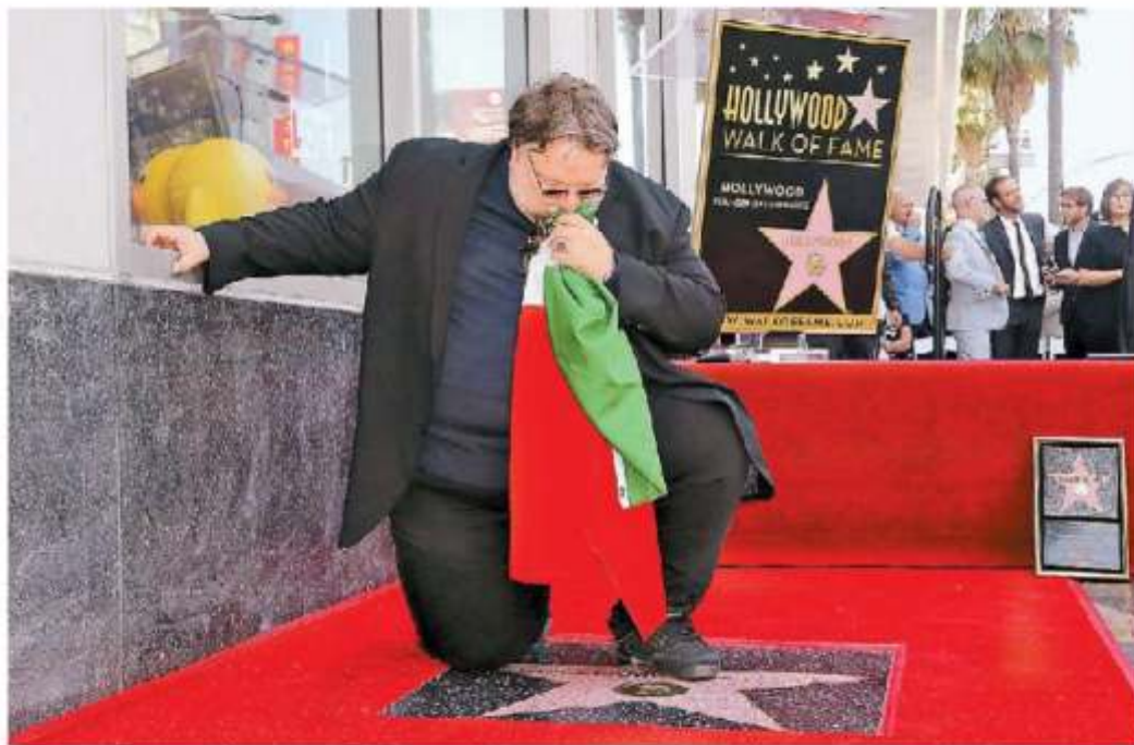
Guillermo del Toro recibió ayer su estrella en el Paseo de la Fama de Hollywood y dirigió un mensaje a favor de los migrantes.

Historia desde El Paso Entre las víctimas, familia separada por actual política MELISSA DEL POZO - PÁG. 8