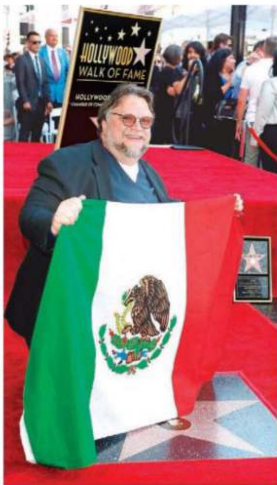
Guillermo del Toro develó ayer en Hollywood su estrella en el Paseo de la Fama. Gritó con orgullo: "Soy mexicano y soy inmigrante", y recordó que el mundo vive un momento "de gran miedo y división", por lo que pidió a la sociedad que rechace "el miedo y las mentiras".

Del Toro, con estrella en Hollywood, pide rechazar el miedo y las mentiras