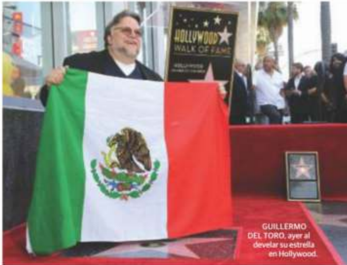
GUILLERMO DEL TORO, ayer al develar su estrella en Hollywood.