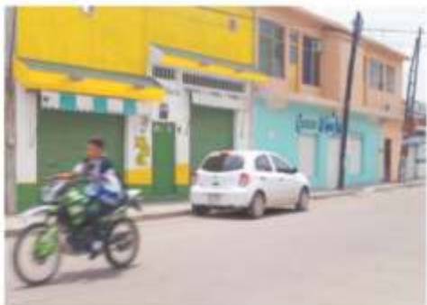
El temor ante las extorsiones de criminales a comerciantes paralizó ayer a Celaya. Tortillerías y otros establecimientos optaron por no abrir.

Los industriales de la masa y la tortilla acordaron cerrar sus negocios por tres días, del sábado al lunes pasados, en protesta por las extorsiones de las que son objeto por parte de grupos criminales. Sin embargo, ayer continuaron con las cortinas abajo. El miedo creció el lunes tras el asesinato de la dueña