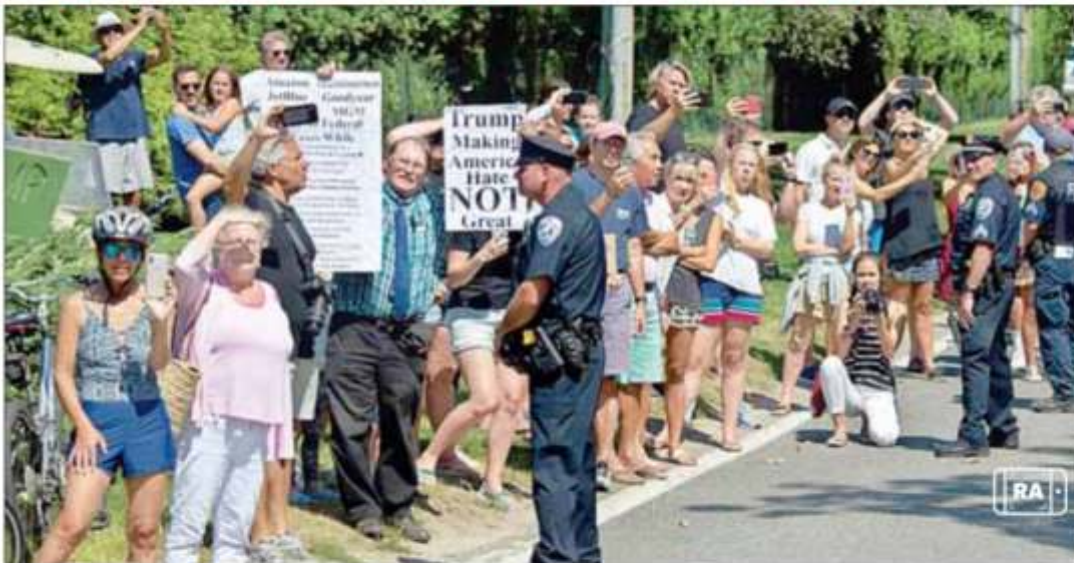
▲ Al momento de rendirse, Patrick Crusius confesó el propósito de su ataque, confirmaron autoridades estadounidenses, mientras Donald Trump defendió ayer las reformas de "sentido común" sobre

Iba por mexicanos, aceptó el tirador de Texas