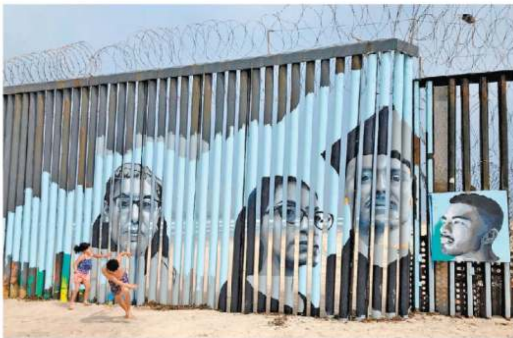
Retratos de mexicanos deportados colocados en la frontera de Tijuana con San Diego.