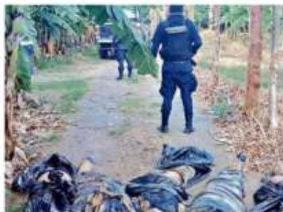
El jueves la violencia fue en la zona centro y ayer en el norte.