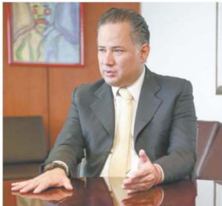
Santiago Nieto Castillo dice que presentará nuevas denuncias para que ningún caso de corrupción quede impune.