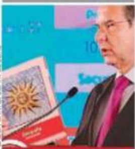
GALEA CAMAC/QUIRANT OSCURO

Banderazo a los libros de texto gratuitos; ya están en 88 por ciento del territorio: SEP