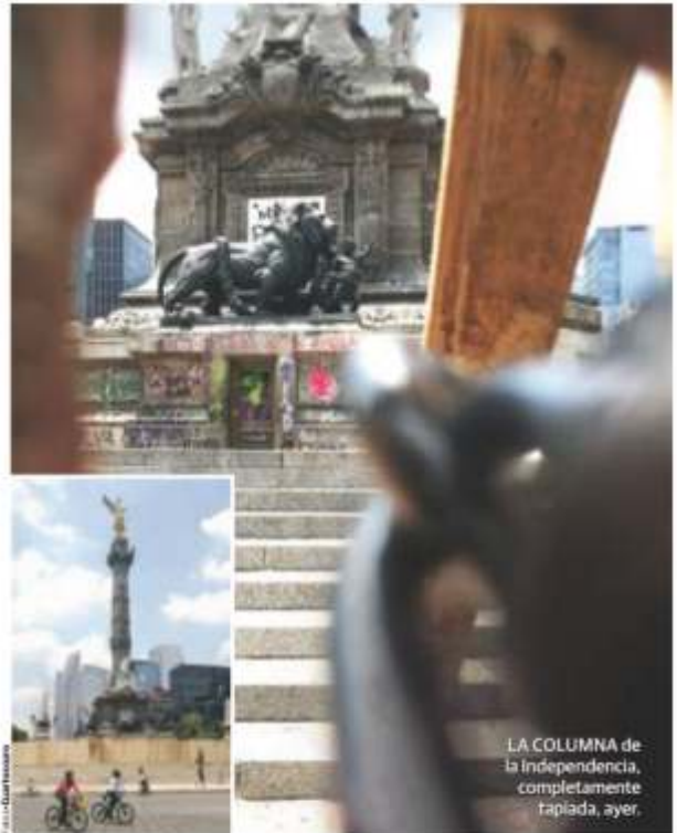
LA COLUMNA de la Independencia, completamente tapiada, ayer.

Observatorio de Igualdad de Género de AL y el Caribe reportó 2 mil 795 en última medición; mujeres, mayoría en la región, pero sin derechos plenos. págs. 20 y 21