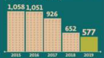
México: proceso de crudo, ene-jun (MILES DE BARRILES DIARIOS)

* Porcentaje exportado con respecto al total producido