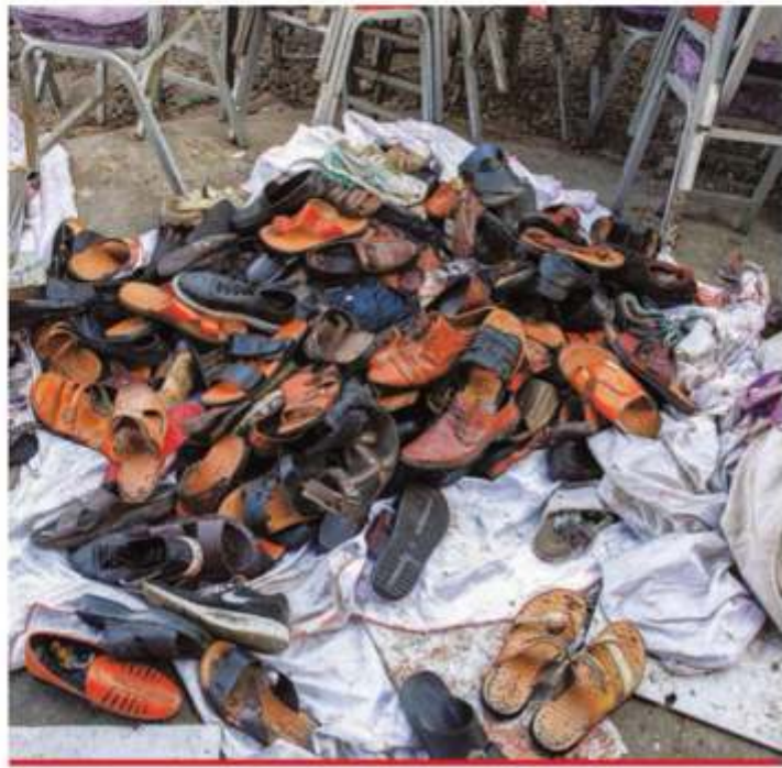
Zapatos y sandalias de las víctimas de un ataque fueron reunidos en un salón de bodas en Kabul, Afganistán, donde ayer terroristas del Estado Islámico hicieron estallar explosivos. Murieron 63 personas y otras 182 están heridas. El ataque suscita dudas sobre la paz en ese país tras un posible acuerdo entre los talibanes y Estados Unidos.

Atentado del Estado Islámico: 63 muertos