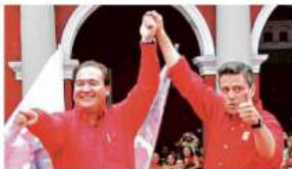
Javier Duarte y Enrique Peña en tiempos electorales.

Fuentes allegadas al caso que pidieron no ser citadas dijeron que la dependencia a cargo de Alejandro Gertz Manero está a la espera de que Duarte dé el primer paso y presente las evidencias con las que dice contar, para valorarlas al igual que su petición.