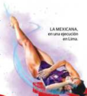
LA MEXICANA, en una ejecución en Lima.

No sé por qué tanta negatividad en el deporte. En el equipo de clavados hicimos un gran trabajo y seguimos siendo el número uno y aún así nos critican y no sé de qué manera podemos contrarrestar"