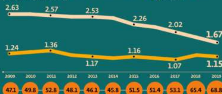
México: producción y exportación de crudo, ene-jun (MILLONES DE BARRILES DIARIOS)

En los últimos 10 años, la proporción de las exportaciones de crudo extraído en yacimientos mexicanos incrementó en relación con el total de la producción, que ha tenido una tendencia a la baja. También el procesamiento en el país descendió. P20