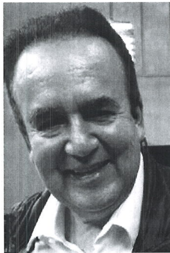
Muy valioso para morena