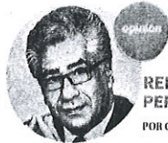
REFERENTE PERIODÍSTICO POR GERARDO DE ÁVILA

Queda esperar que los embates en contra de los mexicanos disminuyan por este intento por destituir al polémico presidente.