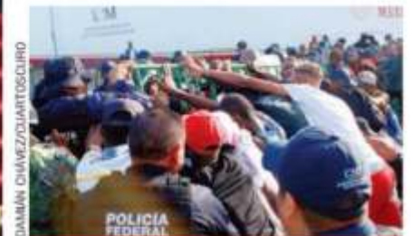
Africanos apostados en la frontera sur de México continúan sus protestas y enfrentamientos con la PF y la Guardia Nacional.