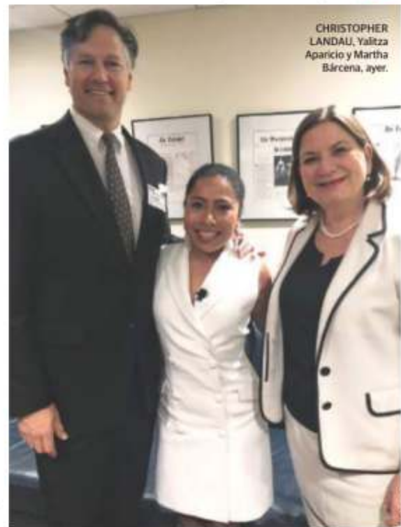
CHRISTOPHER LANDAU, Yalitza Aparicio y Martha Bárcena, ayer.

El embajador de EU, la actriz Yalitza Aparicio y la embajadora de México, Martha Bárcena coincidieron en un evento del BID y se tomaron una foto juntos. pág. 4