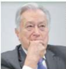
Bartlett dijo que su declaración está en regla, “es falsa la información”.

En agosto pasado, el periodista Carlos Loret de Mola dio a conocer en su columna en este diario que