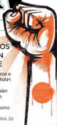
Ilustración: Haracio Sierra