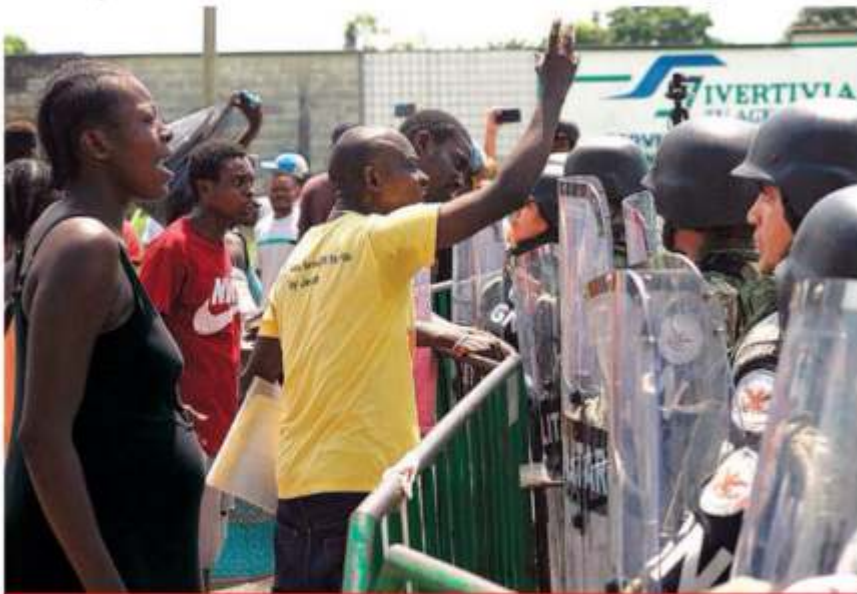
Migrantes de Haití y de origen africano permanecen en las afueras de la estación migratoria Siglo XXI en Tapachula, Chiapas, en espera de una respuesta a su solicitud de cruzar territorio mexicano para llegar a Estados Unidos.

EU presiona a México: frenen a más migrantes