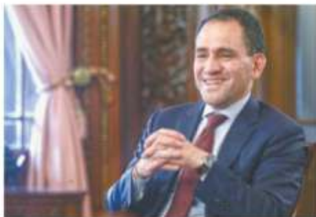
Para el secretario Arturo Herrera, el Paquete Económico es responsable ante el escenario macroeconómico que se plantea para 2020.

Añade que el proyecto tiene la premisa adicional de la disciplina fiscal y financiera, mediante las cuales se sentarán las bases para